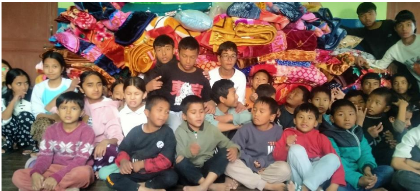
Neue Decken in Sundarijal und neue Pullover bei DSA

Für Juni 2025 ist auch wieder ein Besuch in den Projekten geplant und die Vorfreude darauf ist schon sehr groß. Es ist einfach eine Riesenportion Lebensfreude, die man von einem Besuch mitnimmt!